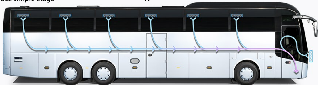
Recyclage de l'air d'évacuation