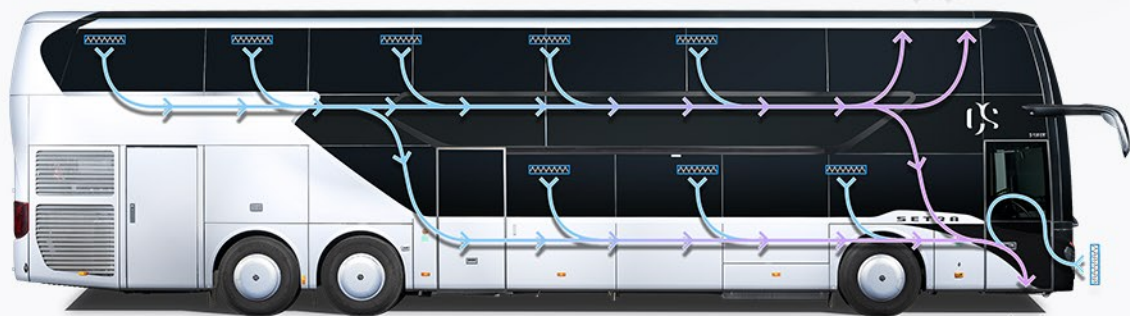
Recyclage de l'air d'évacuation