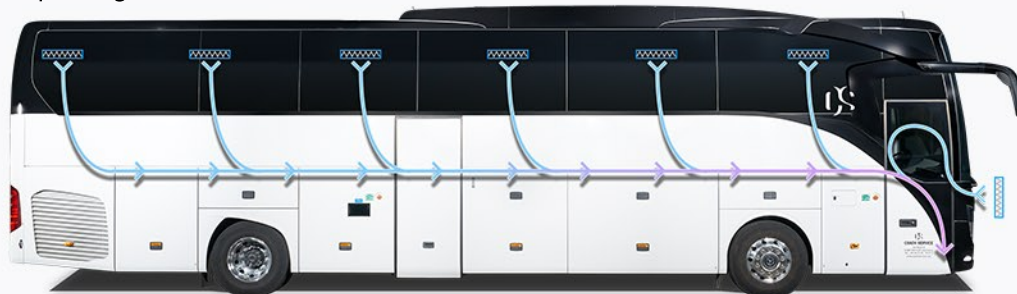
Recyclage de l'air d'évacuation